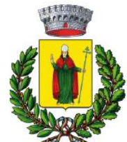
San Felice del Molise