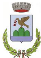
Montefalcone nel Sannio